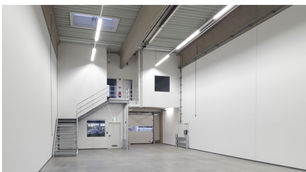
■ Innenansicht vorn