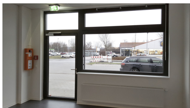
■ Büro Erdgeschoss