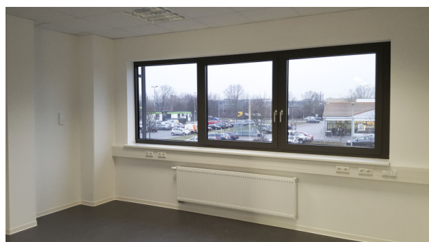
■ Büro Obergeschoss