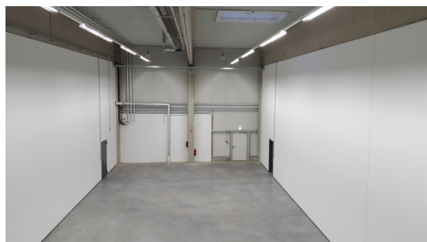
■ Innenansicht hinten